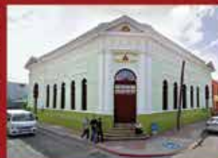
Centro Cultural Sociedad de Artesanos Hidalgo