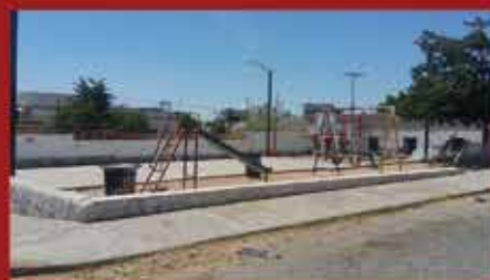
Parque Juan Álvarez