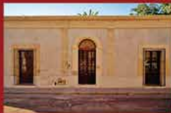
Galería Estudio Ozuna